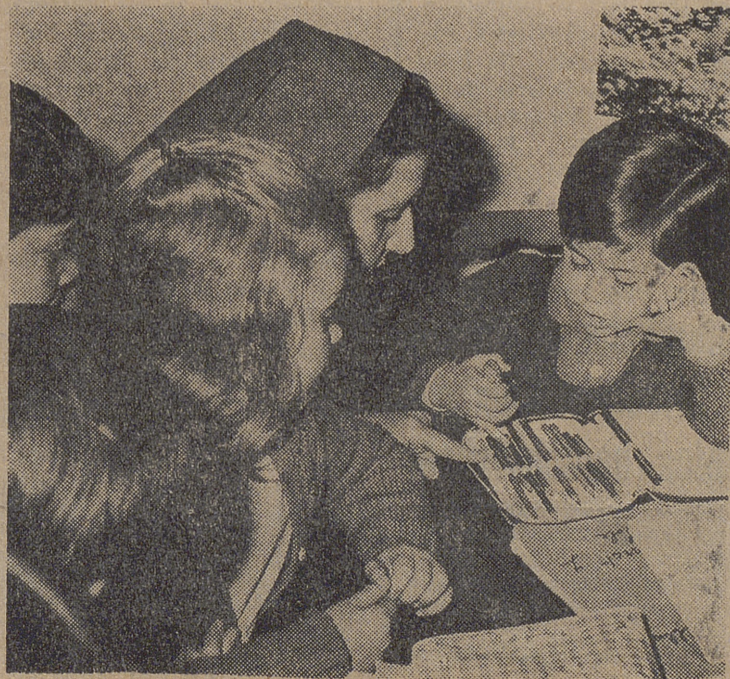
Disponiéndose a hacer los "deberes" escolares...

—Corre a cargo de la Junta y del Tribunal Tutelar de Menores, que nos facilitan una