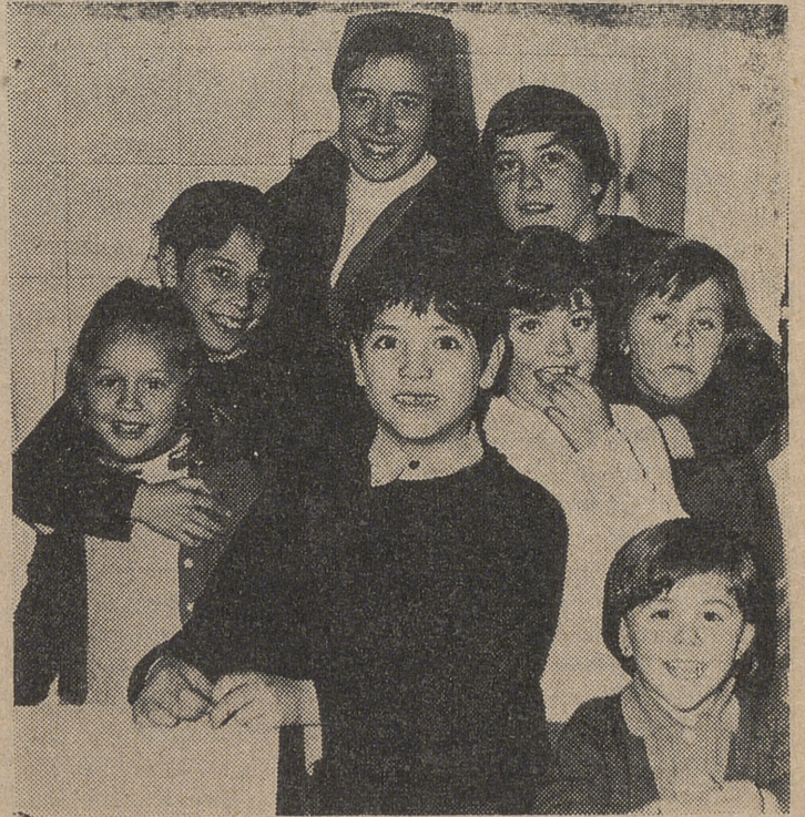
Los niños improvisan un grupo y se fotografian así de alborozados

—¿Cómo se financia, o, mejor aún, con qué medios