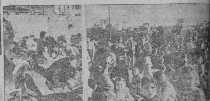
No... no son buscadores de oro de perlas palmesanas, californianos. Son buscadores

Kilos de perlas, a veintitantos duros, hacia Barcelona. El negocio decrece. -Si se removieran ciertas calles