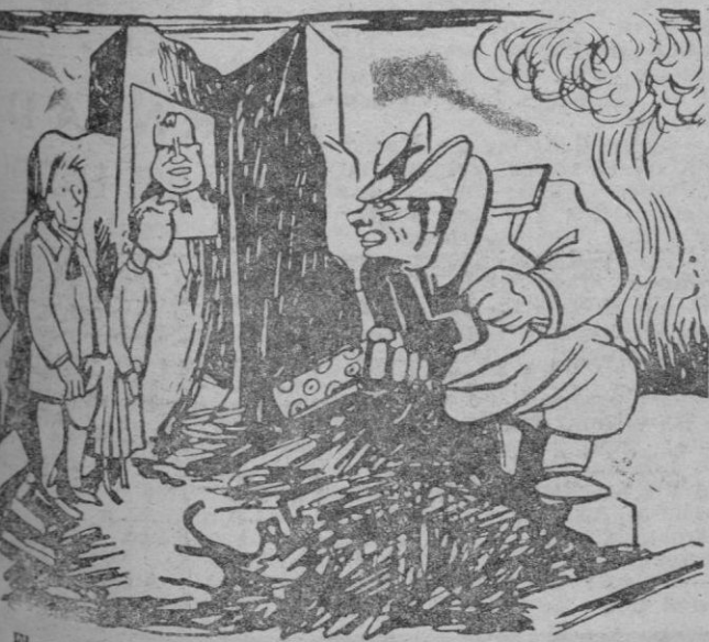
El soviético. — ¿No hay agresores entre vosotros, camaradas? (De "L'Aurore" - París).