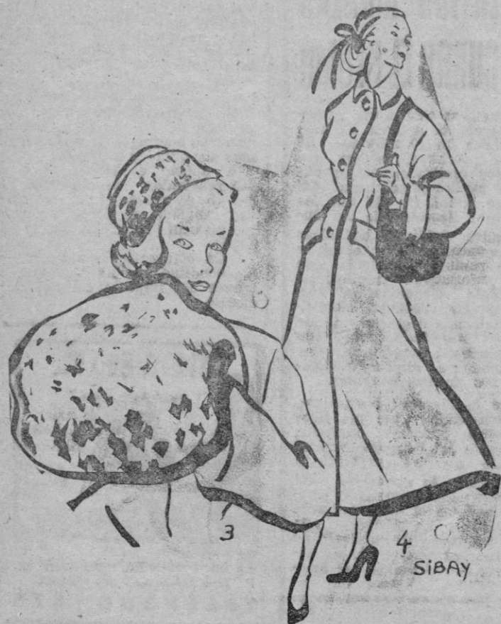
3 y 4. Con el modelo número 4, de líneas clásicas en lana verde musgo, puede llevarse un gorro y manguito de piel de armiño.