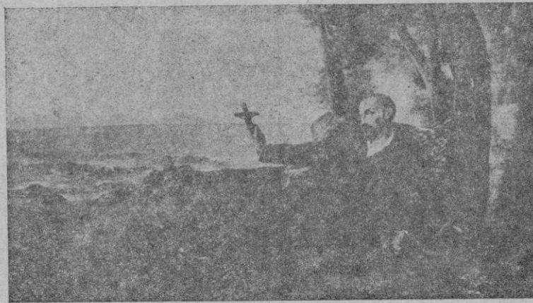
La muerte de San Francisco Javier

"Espántanse mucho todos mis devotos y amigos de que haga un viaje tan comprometido y peligroso. Yo me espanto más de