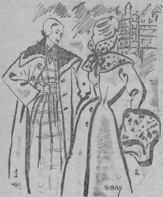
1 Modelo en pelo de camello beige, con cuello en castorina marrón. Vestido escocés. — 2 Abrigo marrón, con gran cuello desmontable y manguito en piel de leopardo. El cuello puede sujetarse con un lazo de terciopelo marrón o con cierres invisibles.