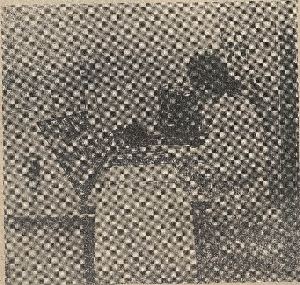
SITUACION DE LA INVESTIGACION BASICA Y DE DESARROLLO

Si en unas pocas palabras se pudiera exponer en qué situación se encuentra, en estos momentos, la investigación en España, podría contestarse diciendo que estamos lejos de alcanzar el panorama óptimo, pero que hemos avanzado bastante en los últimos ocho o diez años. Nos faltan todavía muchas cosas (planificar la investigación a largo plazo, coordinarla, quizás crear un Ministerio de Tecnología, promocionar la investigación en la industria, financiación, ambiente, incluso personal) pe-