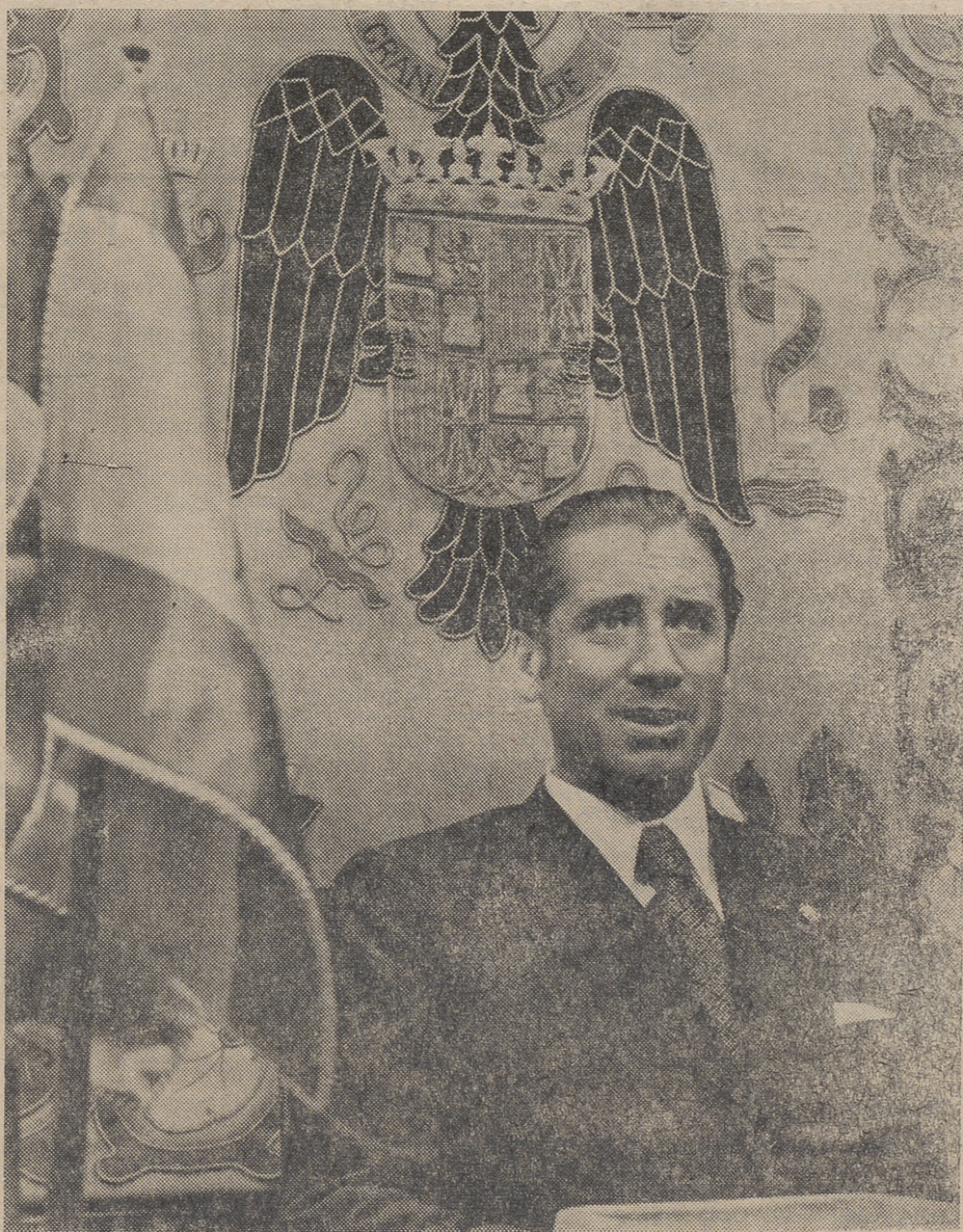
Se encuentra en Madrid el ministro de Asuntos Exteriores de Portugal, Sr. Rui Patrício, que aparece en la presente foto de Europa Press, durante una conferencia de Prensa en la sala de honor del aeropuerto, poco después de su llegada a Barajas, donde fue recibido por su colega español, señor López Bravo, en compañía del cual pasó revista a las tropas que le rindieron honores. Hoy, como se da cuenta en la noticia de arriba, el ministro portugués ha sido recibido por S. E. el Jefe del Estado español.