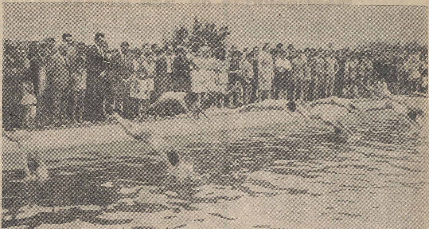
El gobernador civil y jefe provincial del Movimiento, don Ramón de la Riva y López Dóriga presidió ayer en El Tiemblo una jornada de inauguraciones, clausurando también la cátedra de la Sección Femenina. Entre las obras inauguradas figura la magnífica piscinamunicipal (Información en página 4).