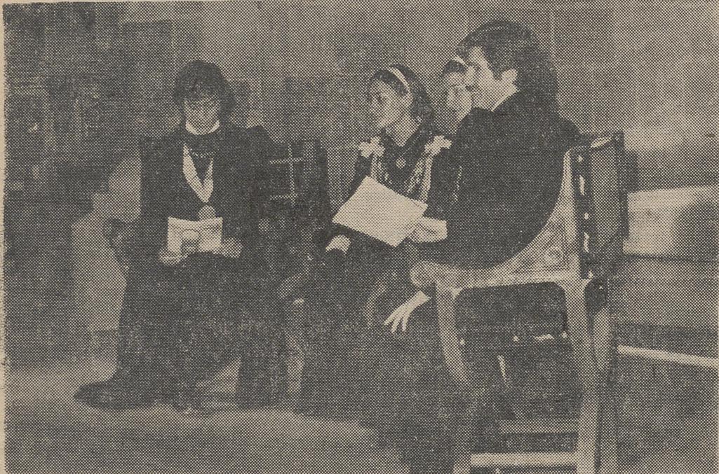
En la segunda jornada de la II Semana de Polifonía, actuó ayer el Cuarteto de Madrigalistas en la iglesia románica de San Andrés. Magnífica actuación que fue seguida y aplaudida por numeroso público.

A las ocho de la tarde, Agrupación Coral de Cámara de Pamplona. Obras de Mompou, M. Flecha, Falla, Bartok, Lópes Graça, Beovide. Director: Luis Morondo.