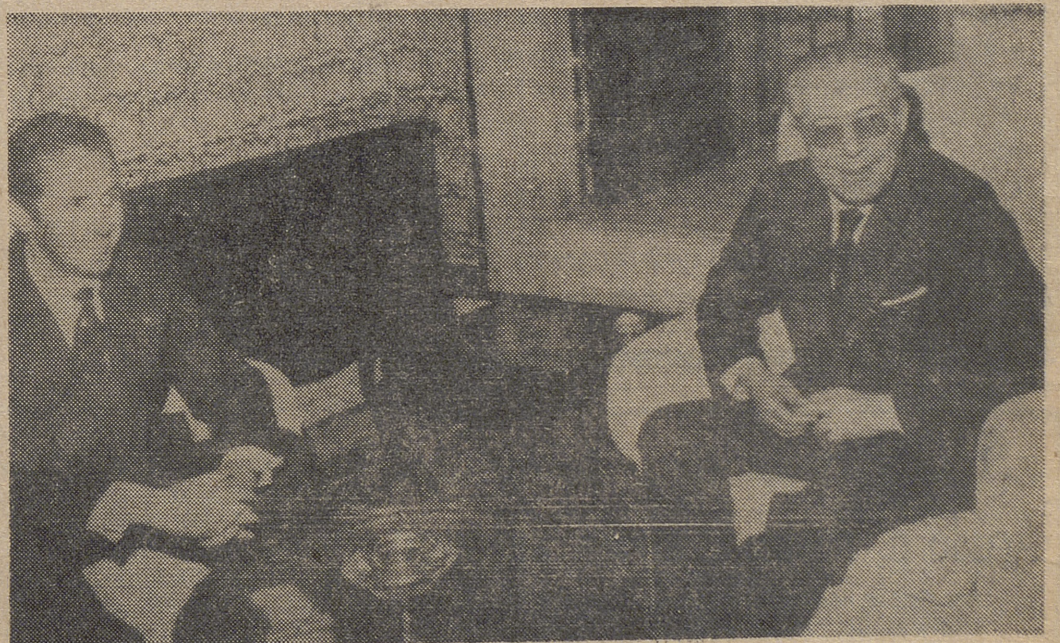
En la fotografía, de Ap-Europa Press, un momento de la entrevista mantenida por el ministro español de Asuntos Exteriores, señor López Bravo con el primer ministro tunecino, Hedi Nour, en el Palacio presidencial.

El ministro hizo constar anteriormente la grata impresión que le había producido la labor del Gobierno tunecino que, en orden y estabilidad, prosigue la tarea del desarrollo en aquél país.