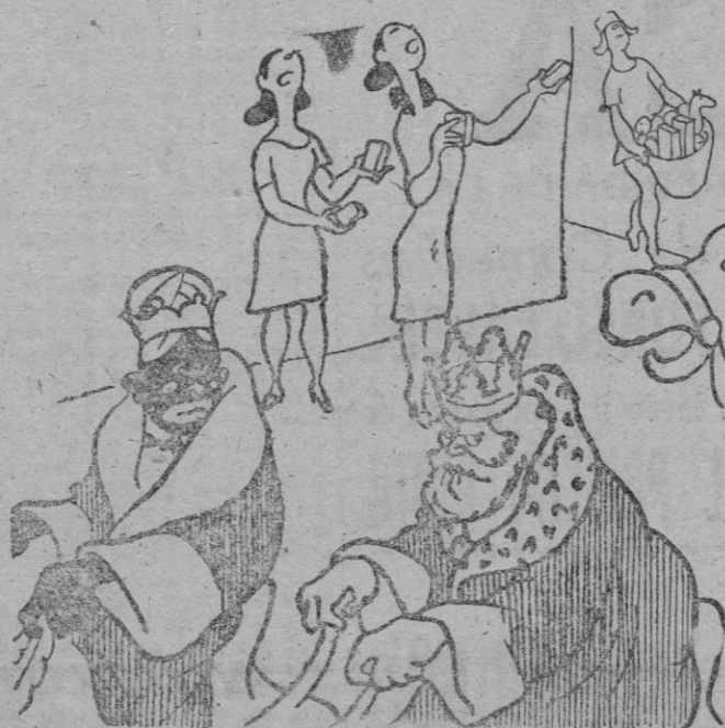
La vendedora. — ¡Hay rubio! ¡Hay negro! Los Magos. — No hay manera de asar de incógnito.

Ya no es posible cambiar la situación si no es por la fuerza. Así es la situación. Ahora ya no es posible cambiarla, porque se han hecho hechos concretos que alteran por la fuerza que no es de esperar que emplee por ahora. el nuevo ministro puede organizar un gran número de conferencias internacionales, y se nos ejecuten en la forma los discursos dados ante los hechos. Lo peor de la situación actual no es que sí. Lo peor es que se te a rectificación de solución previsible. C. Delgado