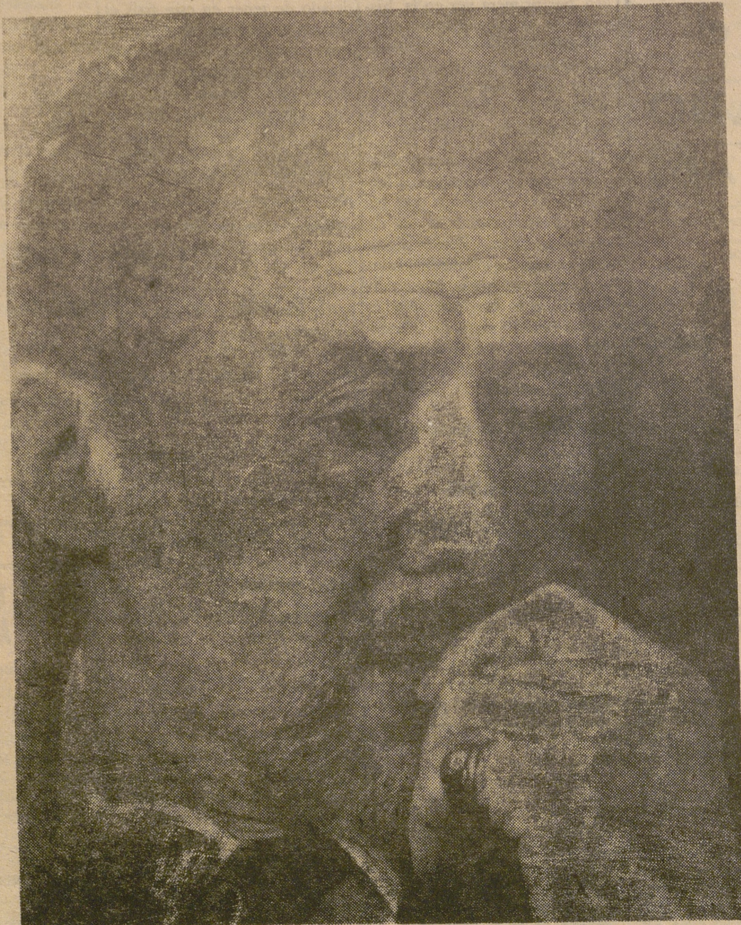
Anthony Quayle, a sus cincuenta y cinco años, está en uno de sus mejores mo- mentos como director y actor.