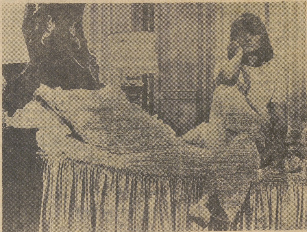
Esta chica puede ser una sonámbula a pesar de su tranquilidad aparente. El sonámbulo obra con naturalidad y no es cierto que camine con los brazos extendidos.