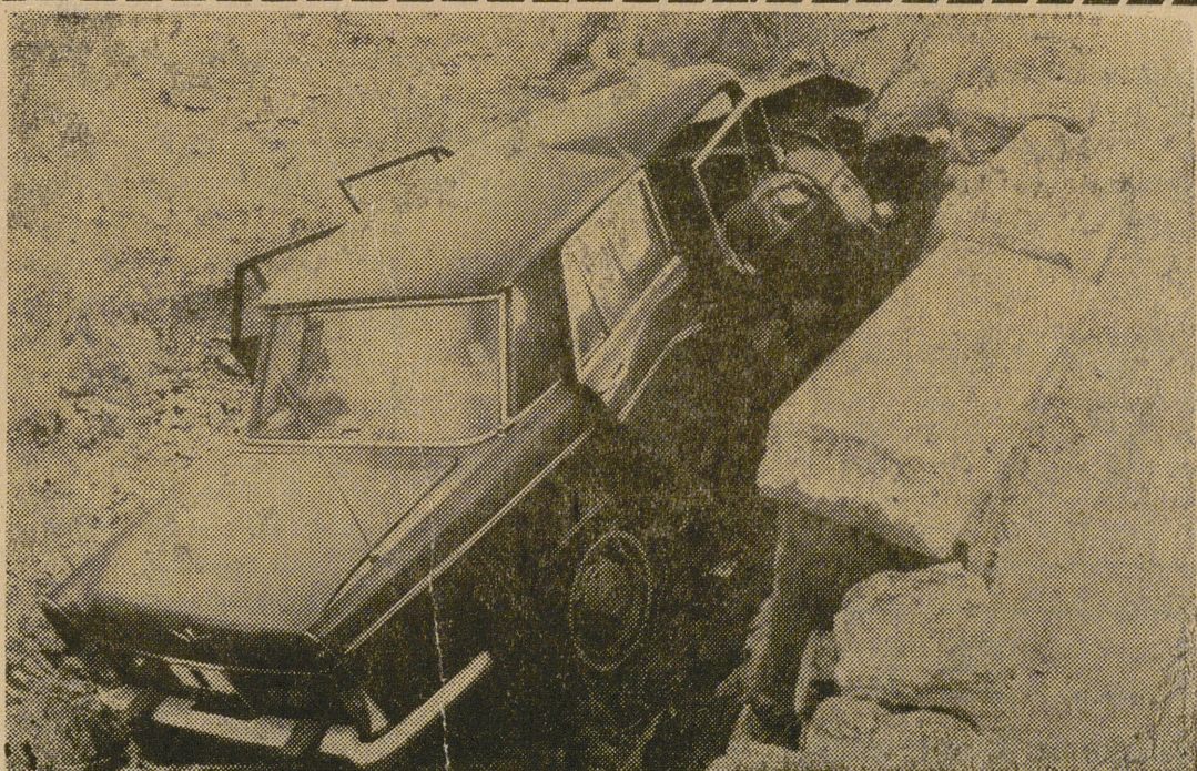
Estado en que quedó el coche que sufrió el accidente en la "Curva de San Segundo", en la ronda, y en el que resultaron heridos sus cuatro ocupantes que como ya informábamos ayer, habían robado el automóvil en Madrid.—(Foto Mayoral).

"Los incendios pueden producirse por pequeñas chispas que arden con intensidad propagando el fuego con gran violencia. Su extinción es extraordinariamente difícil".