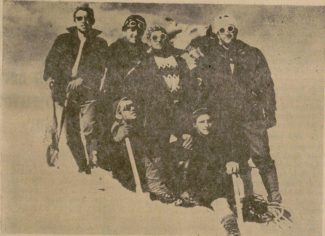
En la cumbre "Punta Gnifetti" (4.559) la cordada del grupo "Los Aguilas", con otros dos montañeros que formaban parte de la cordada italiana que les acompañó.

...Y «Punta Gnifetti» ha sido abordada por estos cuatro alpinistas aguilarenses, en una estupenda escalada llevada a cabo en los primeros días del actual mes de agosto.