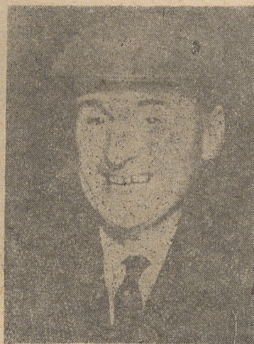
Por Roy FOSTER

jaá a partir de ahora como ritad en un banco londinense