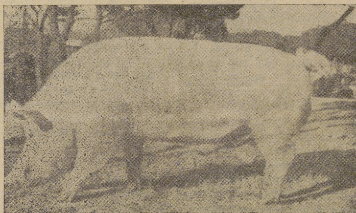
Semental Large White, de gran aclimatación

—Indudablemente el censo ha disminuido, principalmente en las especies lanar, caballar, mular y as-