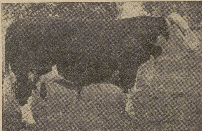
Semental Hereford, destinado a la cabaña abulense

—Hay que confesar que en las partes de la provincia que he visitado con cierto detenimiento, los alojamientos para el ganado no reúnen las condiciones precisas para una racional explotación del ganado y pienso que en el resto de la misma no será muy distinto de lo visto ya. No se crea que con esto trato de hacer una crítica desmedida de la situación, sino plantear el problema en su cruda realidad y para ello es preciso tener en cuenta que en muchas ocasiones las condiciones de habitabilidad de los edificios destinados al alojamiento de las perso-