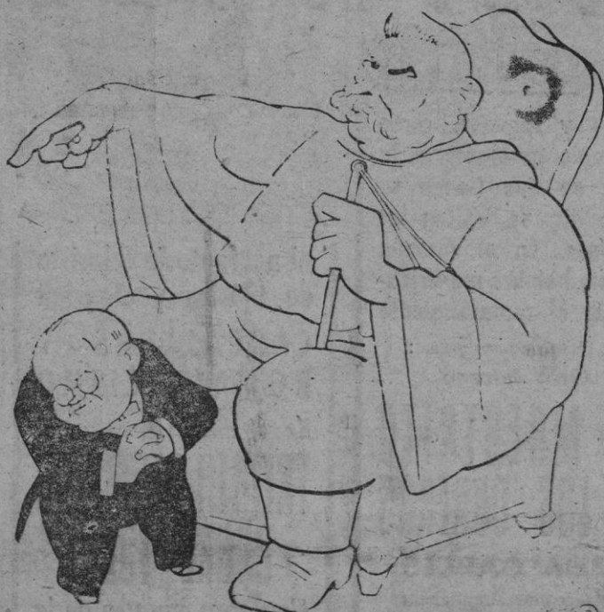
Molotov. — ¡Oh, señor! ¿Seréis capaz de vetarme a mi?