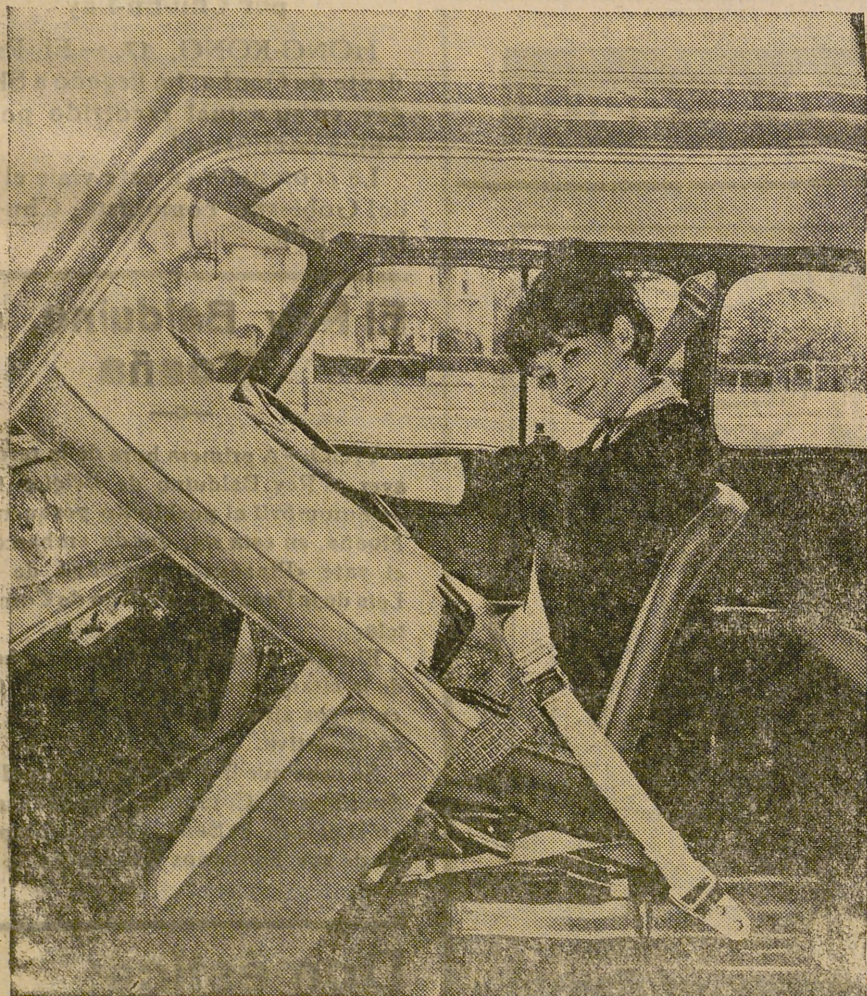
Todos los modelos actualmente en producción, de la British Motor Corporation, de Birmingham, tienen puntos integrales de enganche para correas de seguridad. En este gráfico, una señorita prueba un cinturón de seguridad fijado al túnel del árbol, la bisagra de puerta y el estribo.

ELIXIR ESTOMACAL SAIZ DE CARLOS ESTÓMAGO — INTESTINOS