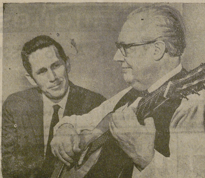
Andrés Segovia (a la derecha), el mejor guitarrista clásico del mundo, charla en Nashville (Tennessee) con Chet Atkins, un destacado guitarrista norteamericano de estilo popular. Andrés Segovia estuvo en Nashville le pora actuar como solista con la Orquesta Sinfónica de Nashville.