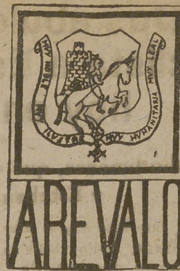
BODAS DE PLATA