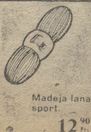
Madeja lana sport. 12 90 Pts.

MAS DE DIEZ MILLONES DE PESETAS EN ARTICULOS RE-BAJADOS AL LIMITE MAXIMO