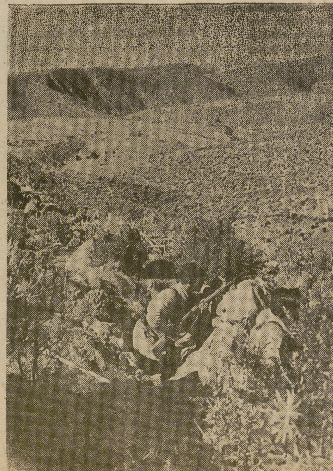
El fotógrafo llegó hasta la primera línea del frente en este sector de Stal-Inf, perteneciente a los famosos Tiradores, a los que se ve en la trinchera vigilantes y alerta.