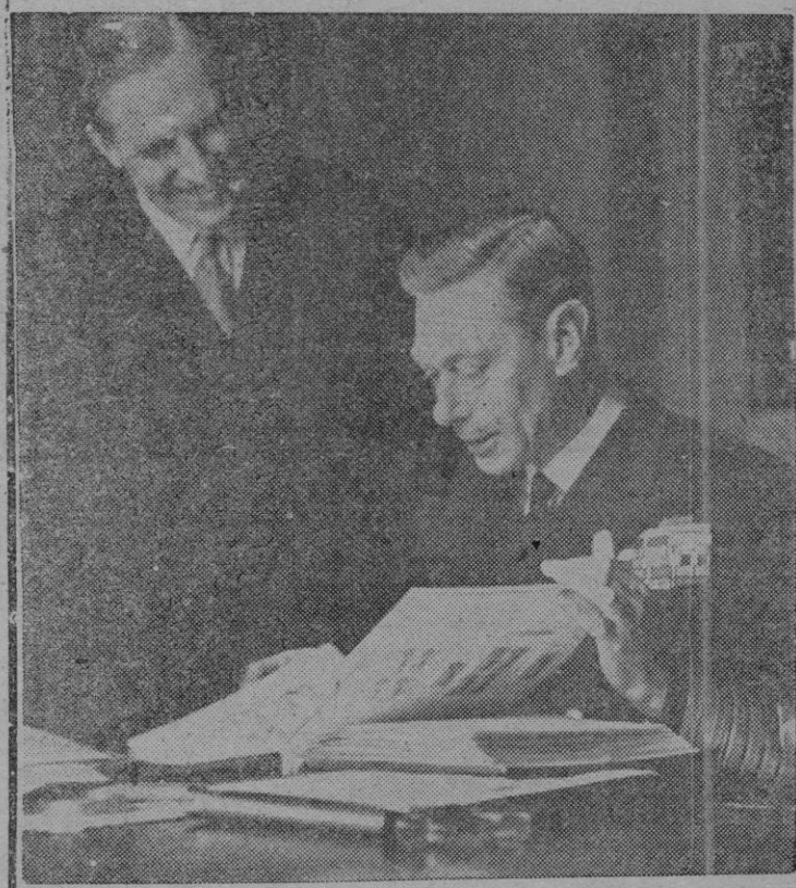
Como su hija Isabel —cuya afición por la filatelia es archiconocida—, Jorge VI, monarca de Inglaterra, posee una de las colecciones más valiosas del mundo, valorada en cerca de un millón y medio de libras esterlinas

El soberano ocupa los ratos de libertad que tiene en las tareas que le son propias, en la ordenación y ampliación de sus nutridos álbumes, que están repletos de rarísimos ejemplares filatélicos.