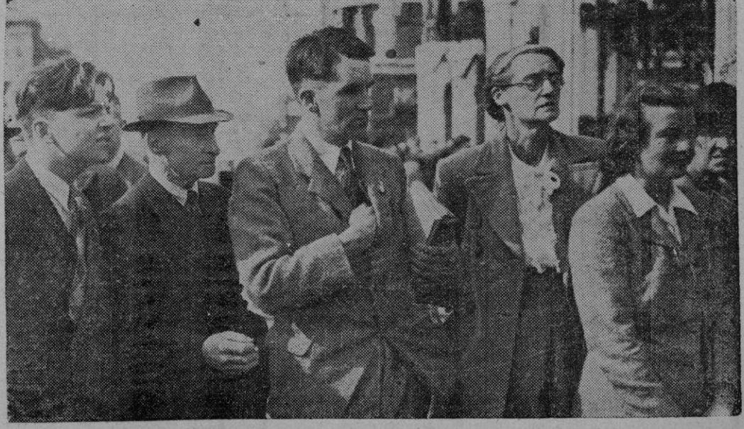
Tras del último discurso del «líder» conservador, Mr. Winston Churchill —en el que hizo referencia a la grave crisis económica por que atraviesa Inglaterra—, la expectación del pueblo inglés ha ido en aumento de día en día. En la fotografía, vemos a un grupo de personas esperando, ante la puerta del edificio de los Comunes, el anuncio de las medidas que el Primer Ministro iba a adoptar para combatir la citada crisis.