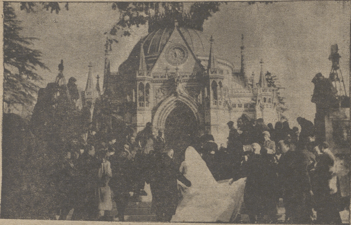
La princesa Elena de Francia, rodeada de fotógrafos por todas partes, a su llegada a la capilla real de Dreux, donde se celebró su enlace matrimonial con el conde de Limburgo Stirum