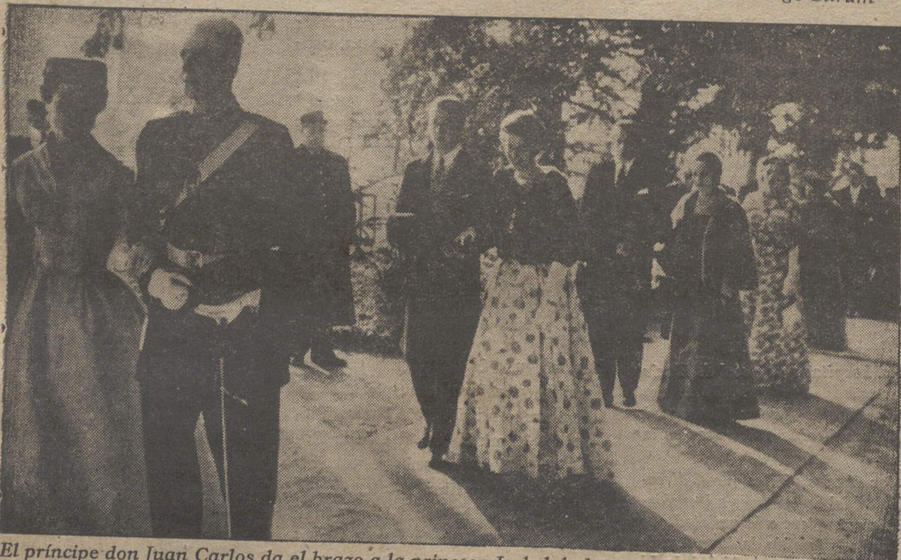
El príncipe don Juan Carlos da el brazo a la princesa Isabel de Francia, hija mayor de los condes de París, en el cortejo nupcial de la boda de la princesa Elena de Francia y el conde de Limburgo Stirum; Siguiendo la costumbre española, es el único que da el brazo derecho a su pareja.