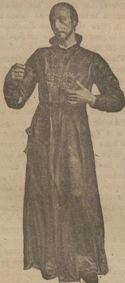
Terminación del triduo