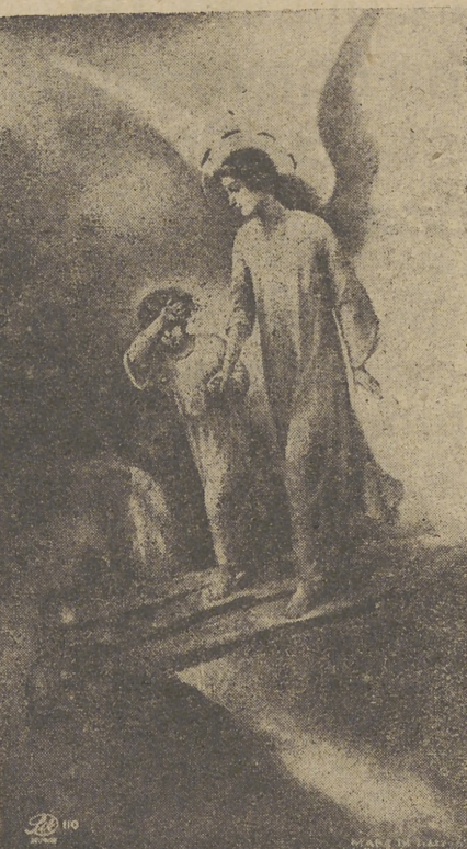
El Santo Angel de la Guarda

La misa y oficio divino son de feria, con rito simple y color morado.