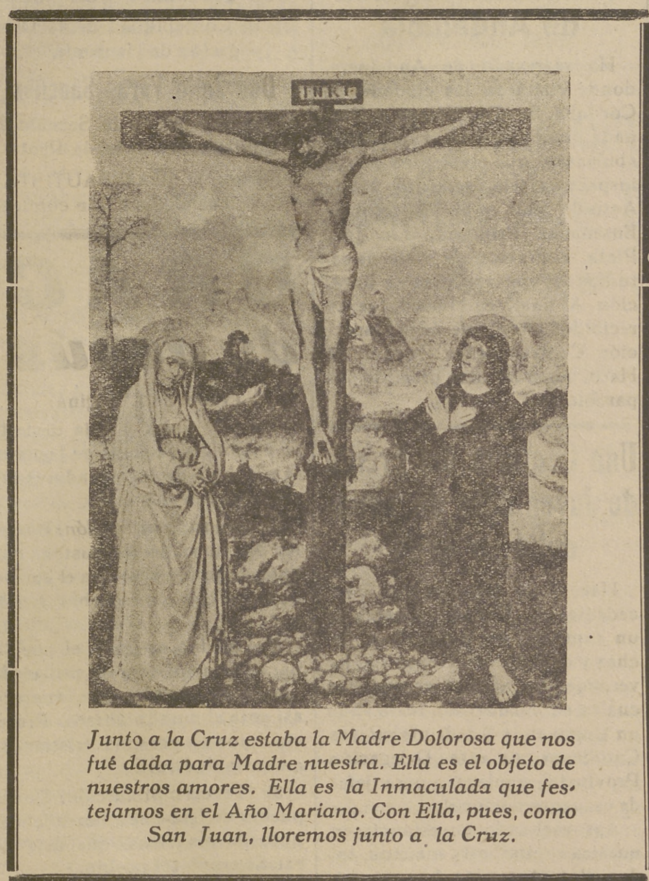
Junto a la Cruz estaba la Madre Dolorosa que nos fué dada para Madre nuestra. Ella es el objeto de nuestros amores. Ella es la Inmaculada que festejamos en el Año Mariano. Con Ella, pues, como San Juan, illoremos junto a la Cruz.

En estos casos el partido mejor del procesado es el silencio. Y así calló Nuestro Señor mientras desfilaban los falsos y pagados testigos. Pero éstos se contradie-