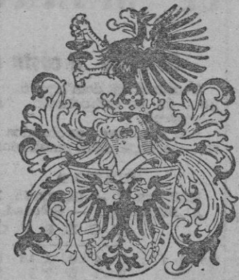
Escudo de armas de la tipografía, instituido por el emperador de Alemania Federico III en 1470.

A LA ILUSTRE FAMILIA «GUASP», DECANOS DE LOS IMPRESORES MALLORQUINES