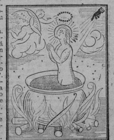
San Juan Ante Portam Latinam patrón de los impresores, (Facsimil de un goig hecho con filetes)

Y ahora, un grito de júbilo: ¡Arriba los de abajo! Porque estos de abajo son los artistas del periódico. Mis amigos de mí y... tantas noches.