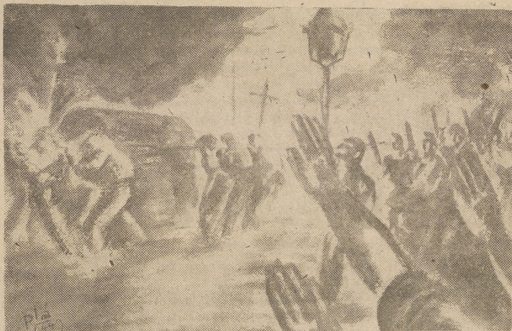
Entre un bosque silencioso de manos extendidas arropado en el manto de la noche española, el cortejo mortuario de los restos del Fundador avanza sobre los nervudos hombros de sus mejores camaradas.