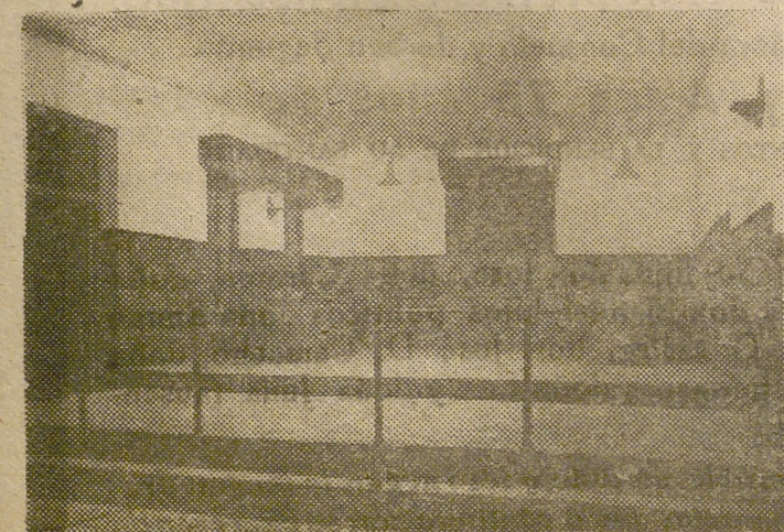
Aquí se consumó el crimen. Las hordas miserables se erigieron en tribunal, para juzgar en sangrienta mascarada al que todo lo dió por su Patria.

«Condenado ayer a muerte, pido a Dios que si todavía no me exime de llegar a este trance, me conserva hasta el fin la decorosa conformidad con que lo praevo, y al juzgar mi alma no le aplique la medida de mis merecimientos, sino la de su infinita misericordia.»