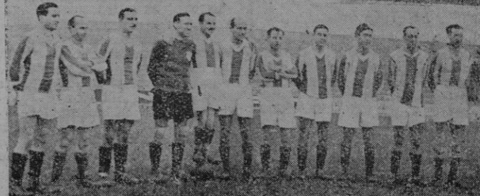
El del Mallorca y el del Baleares, los dos conjuntos — que suman "mil" años — que se esforzaron en demostrar que cualquier tiempo pasado fué mejor

puntos en litigio acarrea siempre estas consecuencias, por más que sea simpático el objetivo de esta clase de encuentros.