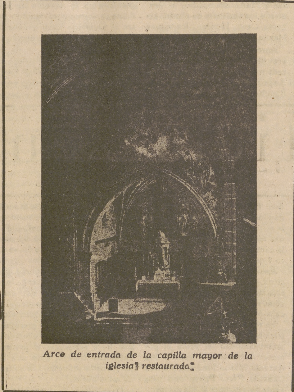
Arco de entrada de la capilla mayor de la iglesia restaurada.