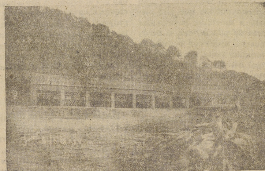
Una de las naves de madera elaborada

Con el fin de asistir igualmente al acto, llegaron de Madrid el de-