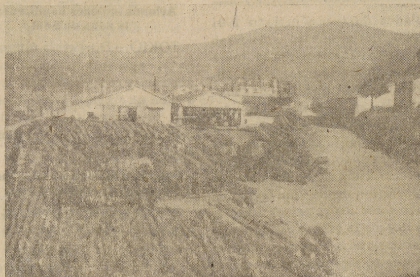
Fábrica de maderas