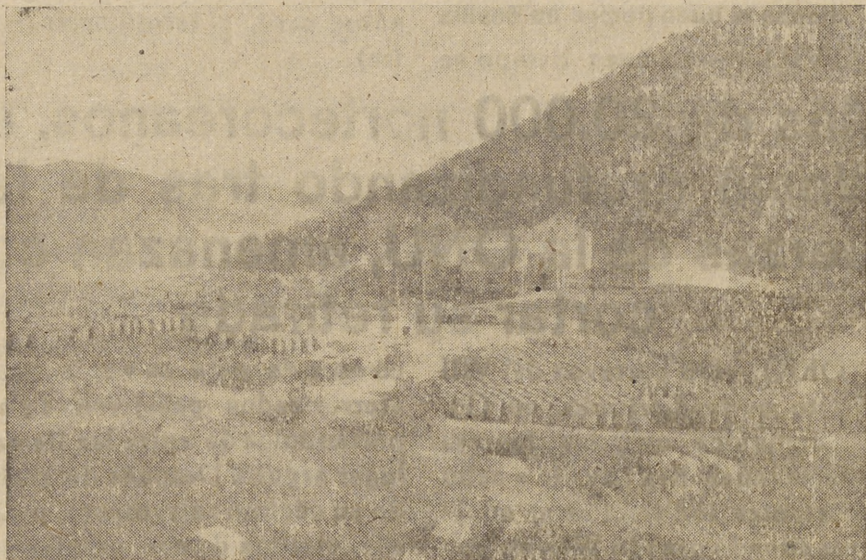
Fábrica de resinas y campo de soleo