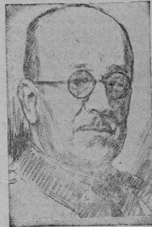
EL GENERAL MOSCARDÓ

Murcia. — El laureado Teniente General Moscardó ha llegado acompañado de sus familiares al