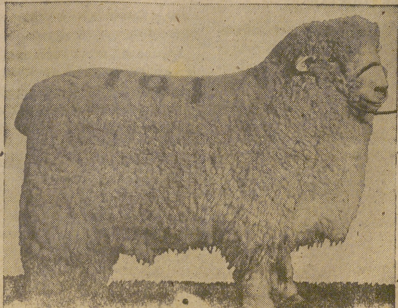
Magnífico ejemplar de la raza de carneros Kent