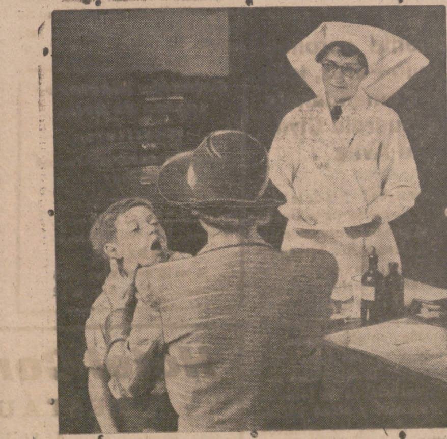
En la clínica médica de esta escuela inglesa los alumnos pueden ser atendidos gratuitamente teniendo a su disposición todos los servicios médicos modernos. En esta fotografía vemos a un alumno que está siendo examinado por una doctora perteneciente a la plantilla médica del mismo.