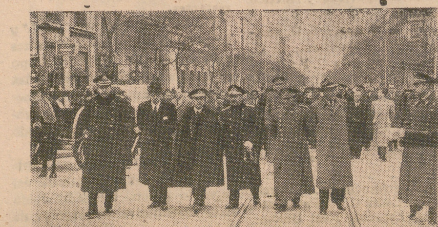
El entierro del Teniente general Orgaz ha constituido una manifestación de sentimiento en Madrid. El duelo fué presidido oficialmente por los miembros del Gobierno y el presidente de las Cortes Españolas y tras esta presidencia la familiar y la del Cuerpo de Estado Mayor.—(S. O. F.)

Tiempo probable.—Abundante nubosidad, alternando con claros en Galicia, Cantabria, cuencas del Duero y Tajo.