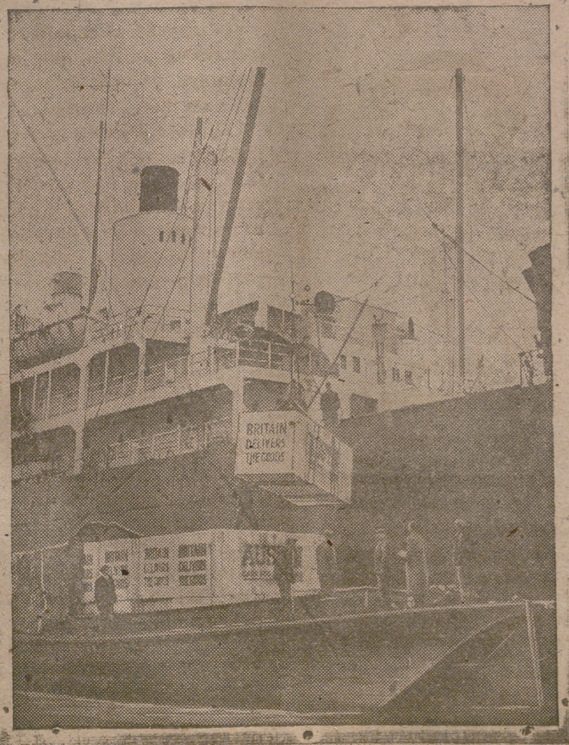
Cargamento de coches Austin embarcado en los muelles de Albert, en Inglaterra, con destino a Ulmar