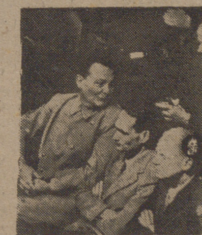
He aquí tres de las más populares figuras encariadas en el proceso de Nuremberg: Goering, Hess y Von Ribbentrop.—(S. O. C.)