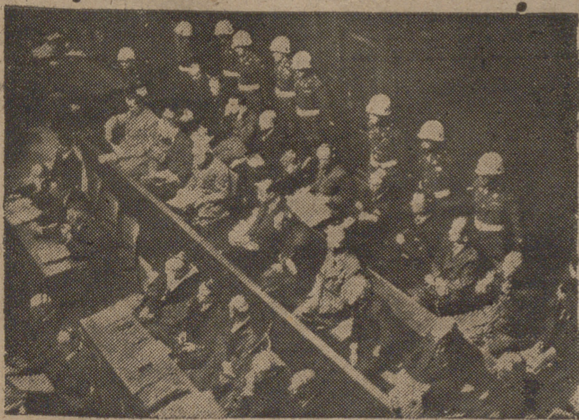
Tras los defensores de los acusados alemanes se hallan éstos en el juicio que se celebra en Nuremberg. De izquierda a derecha, por orden de bancos, figuran en el primero: Goering, Hess, Von Ribbentrop, Keitel, Rosenberg, Franck, Frik, Streicher, Funk y Schad. En el segundo banco en el mismo orden: Doenitz, Raeder, Von Schirach, Sauckel, Jold, Von Papen, Seyes-Inquart, Von Neurath y Friisch.

Sauckel quería que se llevasen obreros franceses a Alemania con preferencia a que fuesen empleados en fábricas francesas, porque decía que estas fábricas sólo producían una pequeña parte del rendimiento máximo. En una conferencia celebrada con Hitler el día 8 de julio de 1940, se estableció que 700 000 prisioneros rusos deberían ser enviados mensualmente a las minas. En 1943, Sauckel