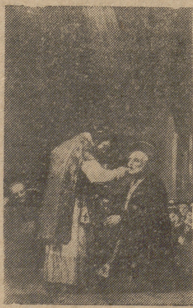
San José de Calasanz, cuadro de Goya.