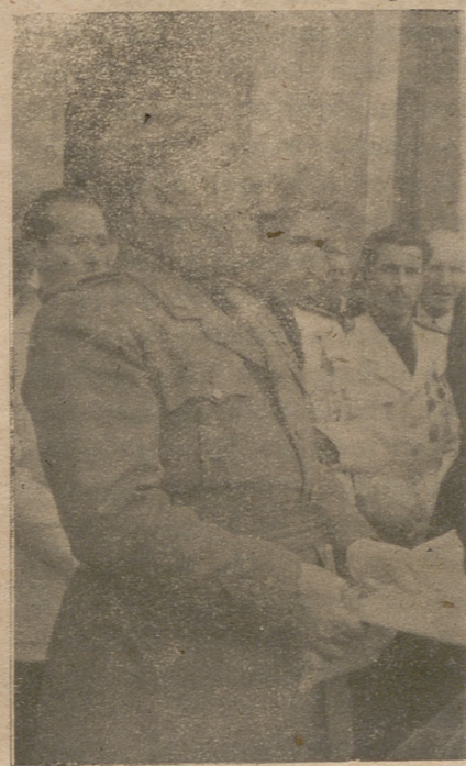
El jefe del Estado y Generalísimo de los Ejércitos pronunciando un discurso al pueblo de Valladolid desde el balcón del Ayuntamiento, con motivo de la clausura del Congreso Agrario