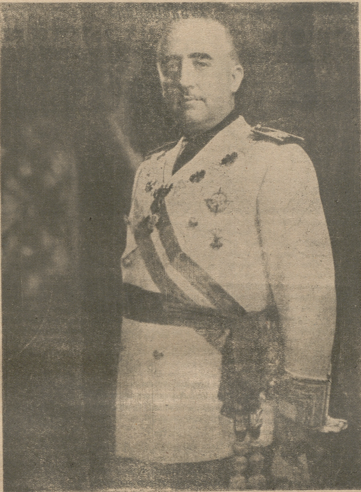
Franco, forjador del triunfo y de la paz de España, recibe el homenaje fervoroso de su pueblo agradecido

Hoy es el momento propicio para hacer un examen detenido sobre estas dos preguntas que nos vienen a la mente: ¿Hemos correspondido o no a los ideales por los que luchamos hasta el día 1 de Abril de 1939? ¿Cooperamos con fervor a la magna obra que en todos los aspectos ha realizado el Estado Español, obra de tal envergadura que admira a propios y a extraños? Indignos seríamos de ser alumbrados por el sol de España si nuestro pensar y obrar no coincidiera plenamente con el de nuestros mártires. «Rojos de alma, aunque vestidos de traje hispánico, no deben quedar en España después de los sacrificios hechos», decía el llorado maestro Sturct.