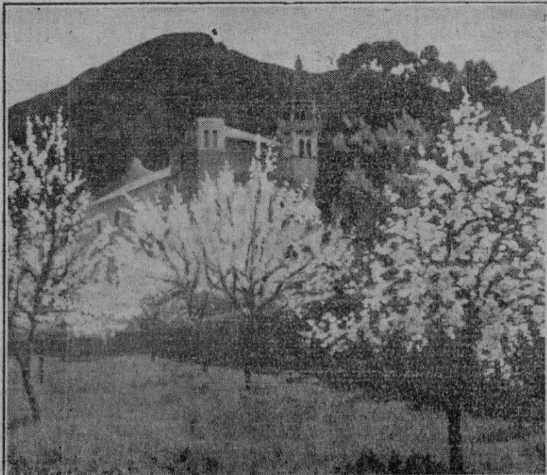
Almendros en flor, Cartuja de Valldemosa