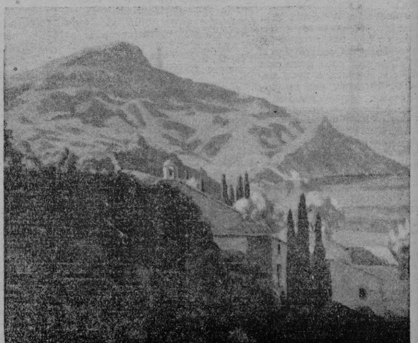
Cuadros de Bartolomé Ferrá