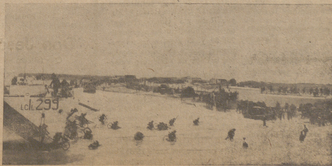
Tropas inglesas desembarcando en el Sur de Grecia.