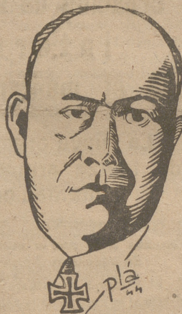
El general Kesselring, artífice de la defensa alemana en Italia

ALICANTE.—La hija del Jefe del Estado visitó el aeródromo de Rabassa. Inmediatamente regresó a Madrid, así como el ministro de Marina.—(CIFRA.)