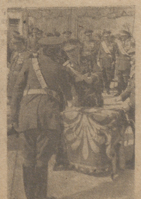
El general Asensio, ministro del Ejército, entrega los despachos en Villa Verde (Madrid) a los cadetes de la Escuela de Transformación.

BUENOS AIRES, 3.—Un telegrama de la ciudad del Vaticano informa que se anunciará pronto el nombramiento del cardenal Federico Tedeschini para el cargo de secretario de Estado del Vaticano.