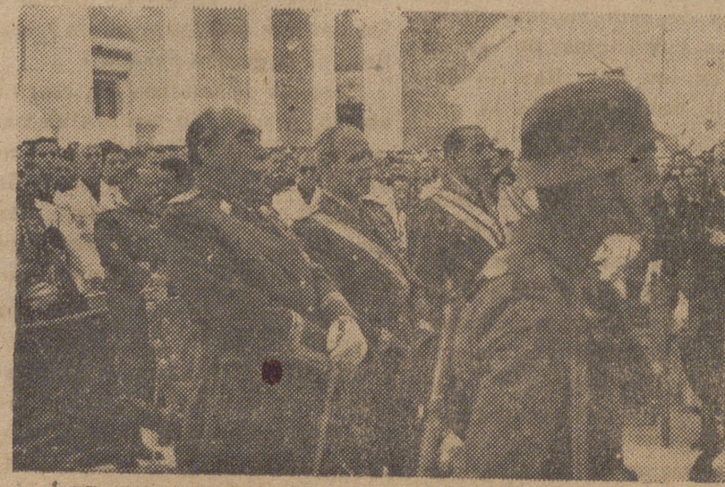
Con motivo del aniversario de la liberación del Alcázar de Toledo se celebró una misa que fué presidida por el ministro del Ejército y el general Saliquet.

Premiados con 250 pesetas todos los números terminados en 11