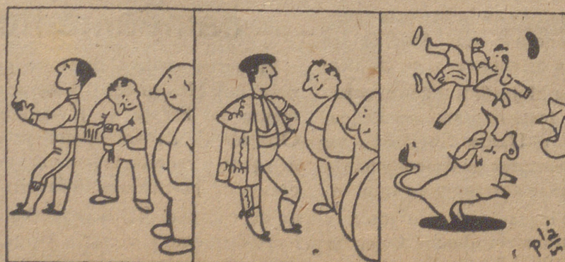
—Una hora para enseñarle. —Media para contemplarle. —Y un segundo para desnudarle.