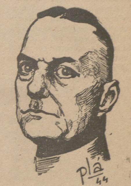
Mariscal von Rundstedt, reorganizador de las fuerzas del Eje que resisten en Holanda.

nes aliados fueron derribados. La ciudad de Nimega fué bombardeada intensamente provocándose