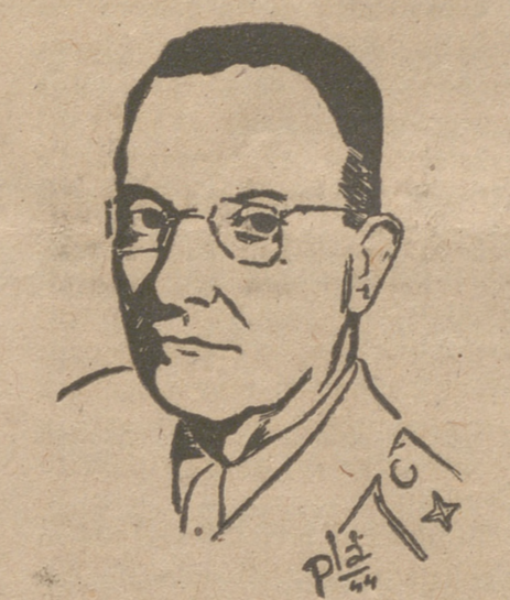
El general bretón, jefe de las fuerzas paracaidistas aliadas en Holanda.

Holanda mediante el empleo de considerables tropas aerotransportadas así como el proyecto de rodear por el norte el bastión de Oeste e irrumpir en Alemania en