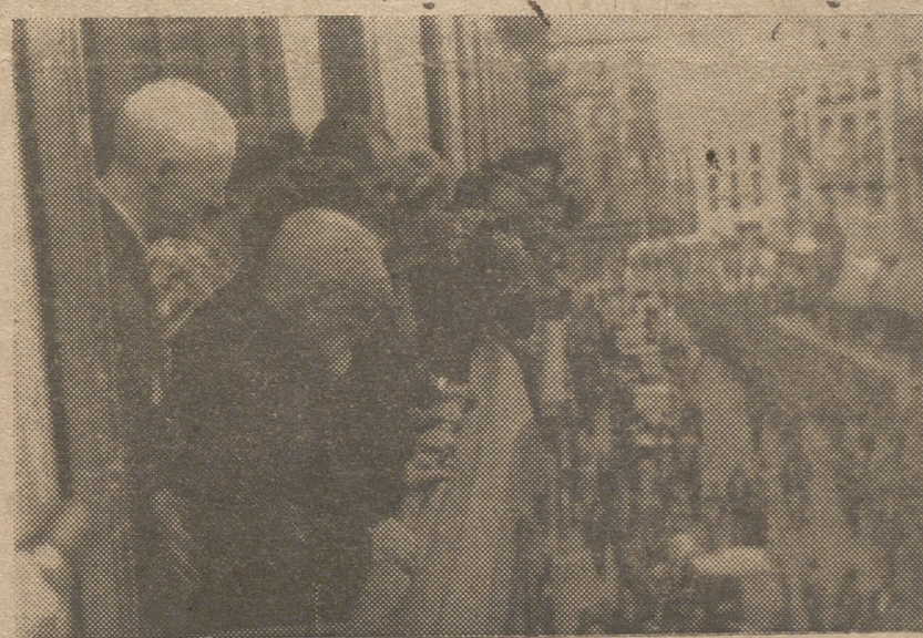
El general don Emilio Díaz Arranguiz que al cumplir los cien años de edad ha recibido el homenaje del Ejército, presencia el desfile en su honor.—(S. O. C.)