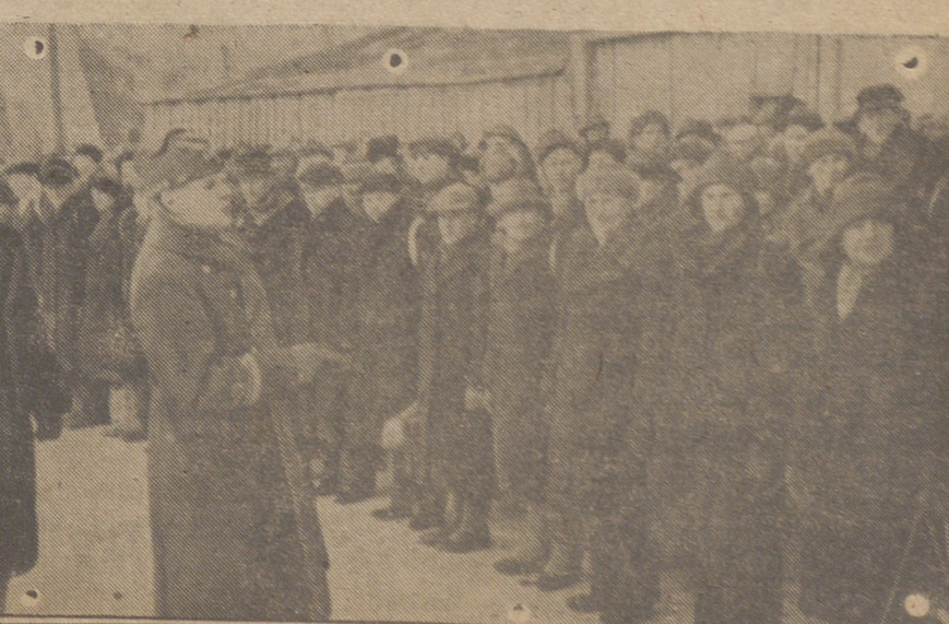
Los últimos reemplazos incorporados se encuentran en la plaza central de la ciudad de Pornau.