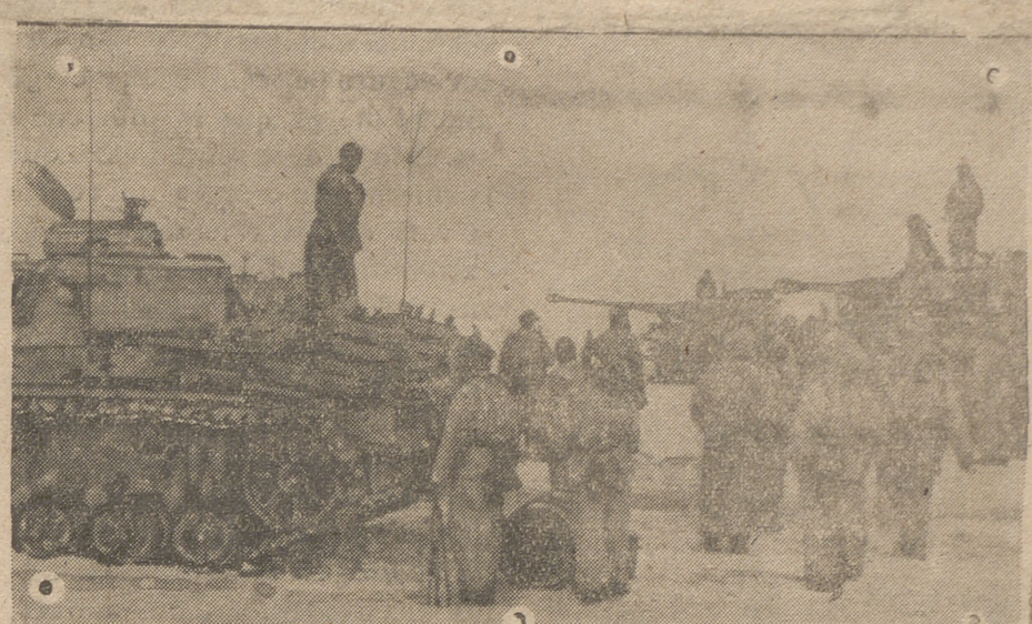
Un grupo de tanques alemanes se prepara para un ataque en el frente del Este.—(Foto «Presamundo»).

japoneses y sus aliados, a pesar de lo intransitable del terreno y de las grandes dificultades de aprovisionamiento.