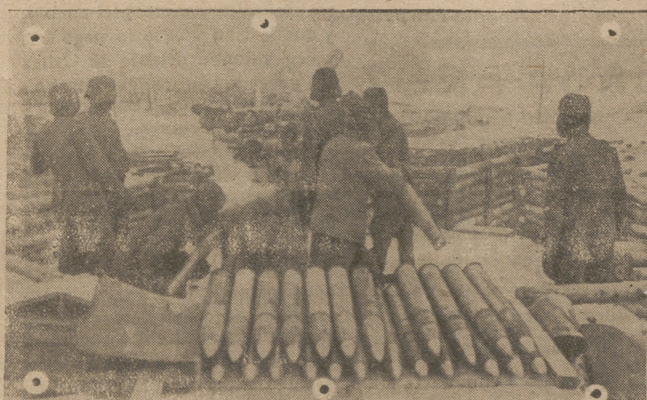
Una batería alemana dispara incesantemente en un sector del Nariva, próximo al golfo de Finlandia impidiendo todo movimiento de los bolcheviques.—(Foto «Presamundo»).

la concentración nacional; todos, desde las derechas a los comunistas, se encuentran ahora agrupados alrededor mío para combatir al lado de nuestros aliados por la liberación total y la restitución de Francia a su antigua grandeza». —EFE.