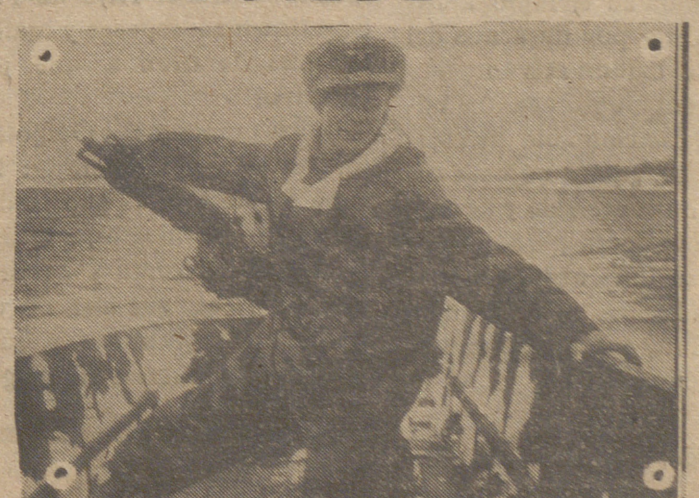
El timonel de este bote de asalto alemán dirige con mano firme la lancha hacia su objetivo.

Ninguna preocupación puede hoy superar en nosotros a la que en estos días venimos sintiendo con el mayor entusiasmo y fervor religioso nos disponemos a vivir en el recogimiento familiar, hermanados todos en los dolores de Nuestro Señor Jesucristo y de su Santísima Madre, la Virgen María. Los santos los llama por antonomasia la Iglesia Católica a estos días Santos Mayor en que conmemoramos la Pasión y muerte del Redentor del Mundo. Días, por tanto, en los que todos los católicos que se precien de serlo deben aprovecharse para la propia santificación.