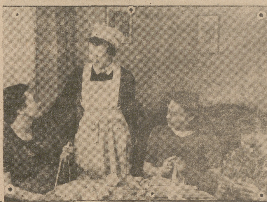
La organización nacional alemana ha establecido hogares para las jóvenes madres alemanas en la Selva Negra. He aquí la foto de uno de estos hogares.