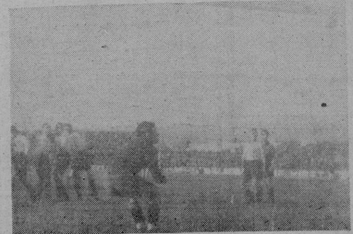
El gran disparo de Primo que se estrelló en el transversal, cuando el portero estaba ya batido.