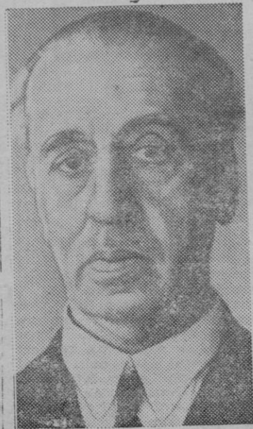
El Excmo. Sr. D. Jaquín Benjumea Burin, Ministro de Hacienda

Los días todos los días CORREO DE MALLORCA