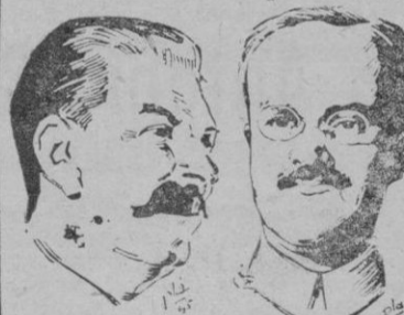
STALIN Y MOLOTOFF

El cambio se cree que se efectuará cuando Stalin regrese de sus vacaciones.