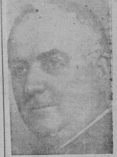
General D. José María Fernández Ladreda, nuevo Ministro de Obras Públicas, en sustitución de D. Alfonso Peña Boenf. El Sr. Fernández Ladreda ha sido director de la fábrica de Armas de Oviedo y de la Escuela Politécnica del Ejército