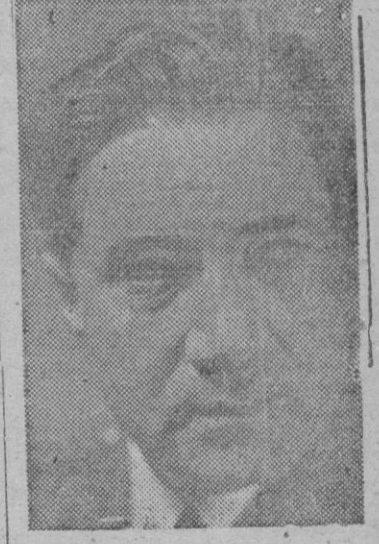
General D. Eduardo González Gallarza, nuevo Ministro del Aire, que reemplaza al Teniente General Vigón. Hasta el presente el General Gallarza era Jefe del Estado Mayor del Ejército del Aire