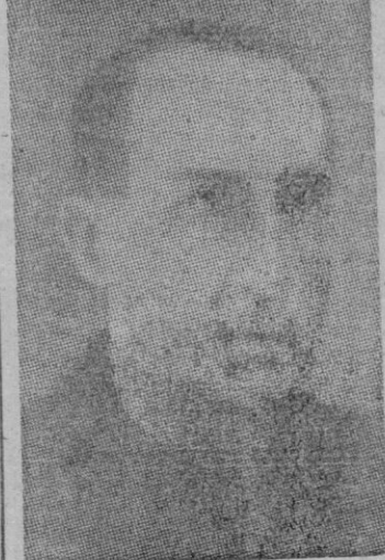
Don Carlos Rein, nuevo Ministro de Agricultura, que sucede a don Miguel Primo de Rivera