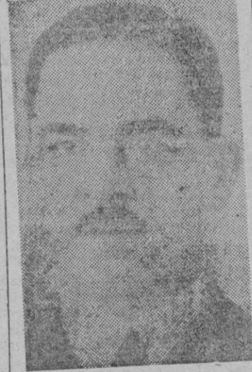
Almirante D. Francisco Regalado Rodríguez, que reemplaza en el Ministerio de Marina al Vicealmirante Moreno y que desempeñó hasta ahora diversos cargos de carácter técnico, principalmente en el Instituto Nacional de Industria