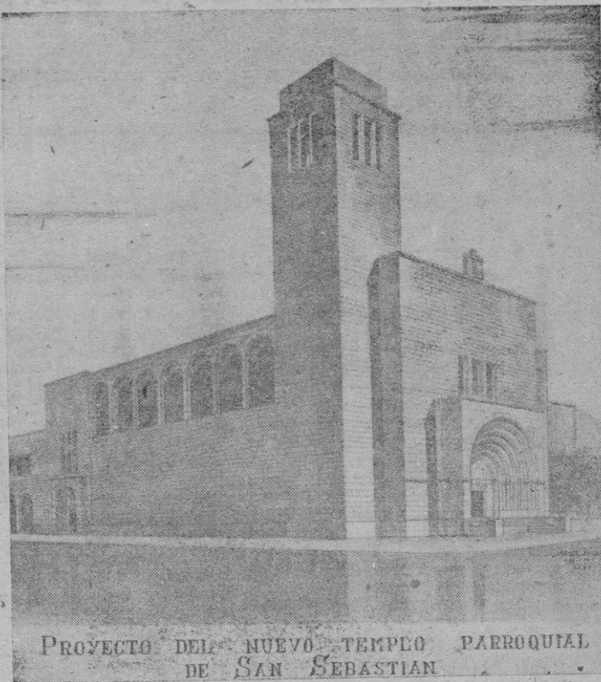
PROYECTO DEL NUEVO TEMPLO PARROQUIAL DE SAN SEBASTIAN