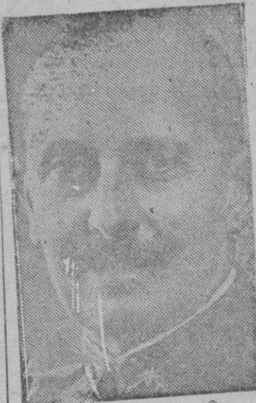
Teniente General D. Fidel Dávila Arrondo, Ministro del Ejército, que sustituye al General Asensio y que desempeñaba en la actualidad el cargo de Jefe del Alto Estado Mayor Central