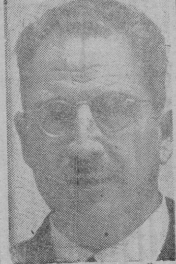
D. Juan Antonio Suances, nuevo Ministro de Industria y Comercio, que sucede a D. Demetrio Carceller