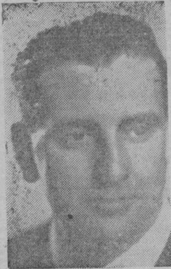
D. Alberto Martín Artajo, nuevo Ministro de Asuntos Exteriores, que reemplaza a D. José Félix de Lequerica. El Sr. Martín Artajo desempeñaba actualmente la Secretaría General del Consejo de Estado