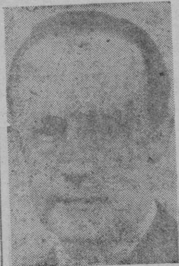
D. Raimundo Fernández Cuesta, Ministro de Justicia, que reemplaza a D. Eduardo Aunós. El Sr. Fernández Cuesta era Presidente del Consejo de Estado