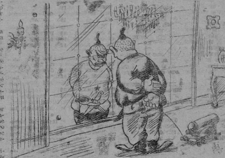
— ¡Uff!... ¡Qué susto!