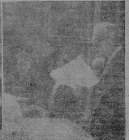
El Alcalde, de Palma dirige la palabra a los reunidos.