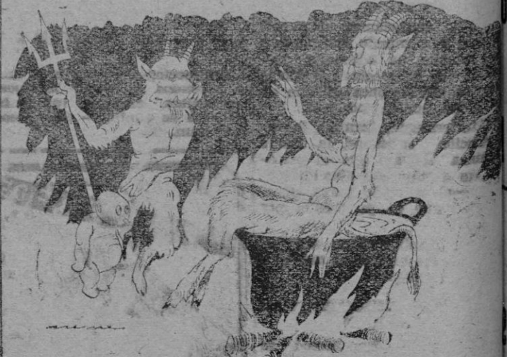
¿Qué infierno le damos a éste? Mandarle al paraíso político que con ello ya va arreglado.