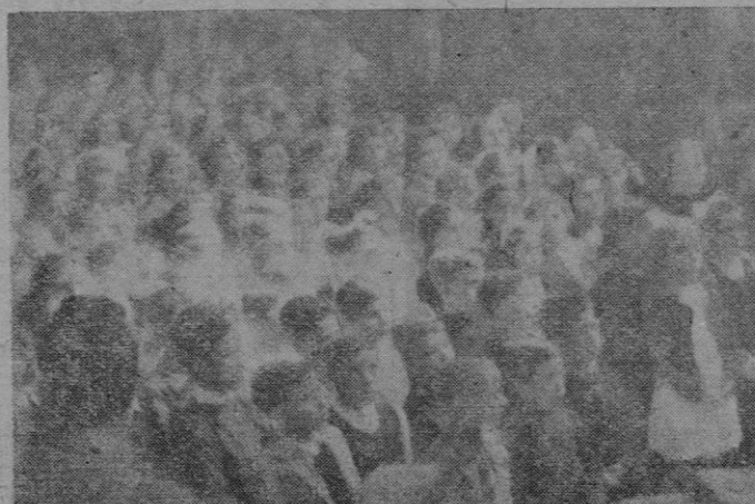
Un aspecto del salón de sesiones, ocupado por los escolares. — El Alcalde, de Palma dirige la palabra a los reunidos